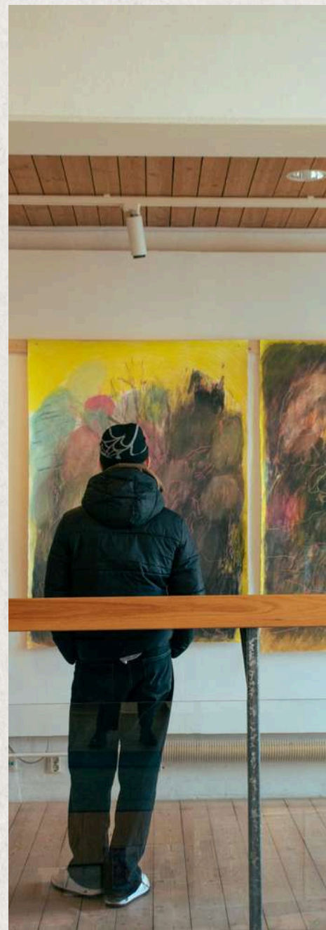
Autore: CHIARA AGOSTINETTO