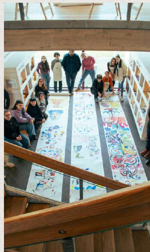
Autore: CHIARA AGOSTINETTO

Rezultātā bija 18 neticami attēli, katrs izveidots ar rokām no dalībniekiem un pilnveidots nedēļas laikā. Šie mākslas darbi, vienoti ar kopīgu krāsu paleti un zaļās domāšanas tēmu, parādīja katra mākslinieka unikālo stilu un radošumu. Papildus mākslinieciskajiem sasniegumiem nometne veicināja ievērojamu personīgo izaugsmi un kopienas veidošanu. Dalībnieki izveidoja stipras draudzības un saiknes, radot atbalstošā, ne konkurējošā vidē. Daudzi mākslinieki ne tikai uzlaboja savas prasmes, bet arī atrada jaunus dzīves draugus, padarot pieredzi bagātinošu gan personīgā, gan radošā līmenī.