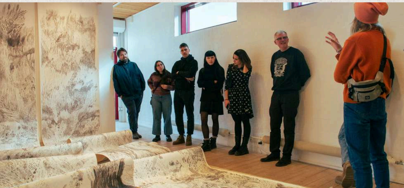
Autore: CHIARA AGOSTINETTO